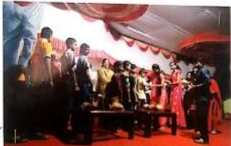
कार्यक्रमाचे उद्घाटन करताना राठी लोहावाडा राष्ट्रीय सेवा योजनेचे कार्यक्रमाचे उद्घाटन - विद्याशिरी.