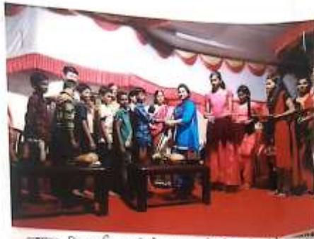
अनाथ विद्याशाला राठी लोहावाडा राष्ट्रीय सेवा योजनेचे कार्यक्रमाचे उद्घाटन - विद्याशिरी.