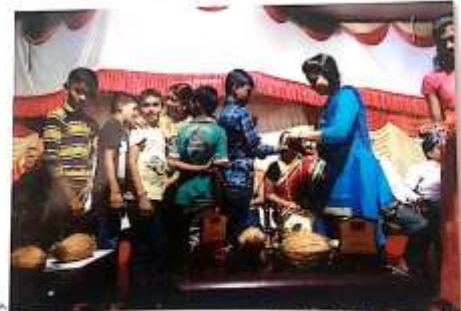
अनाथ विद्याशाला राठी लोहावाडा राष्ट्रीय सेवा योजनेचे कार्यक्रमाचे उद्घाटन - विद्याशिरी.