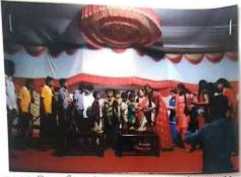
अनाथ विद्याशाला राठी लोहावाडा राष्ट्रीय सेवा योजनेचे कार्यक्रमाचे उद्घाटन - विद्याशिरी.