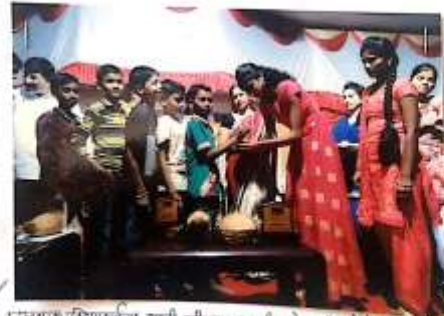
अनाथ विद्याशाला राठी लोहावाडा राष्ट्रीय सेवा योजनेचे कार्यक्रमाचे उद्घाटन - विद्याशिरी.