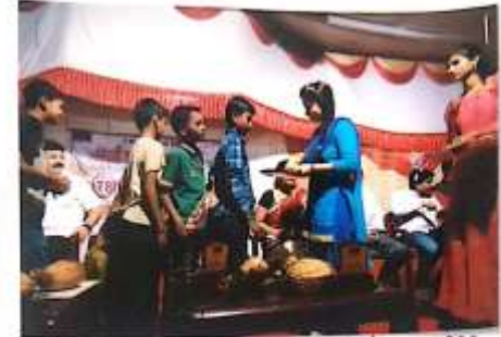
अनाथ विद्याशाला राठी लोहावाडा राष्ट्रीय सेवा योजनेचे कार्यक्रमाचे उद्घाटन - विद्याशिरी.